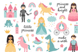
Ridders, prinsessen en draken